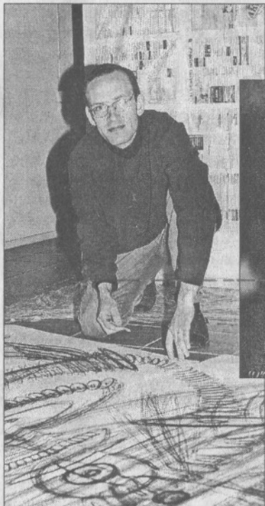
M. Stroliai daugiau impulsų kūrybai teikė ne patys Seteniai, o bendravimas su kolegomis.